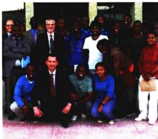
Dr. Dragan Primorac s kolegama i studentima u Bocvani

Dr. Primorac je posjetio kolege u toj afričkoj zemlji radi dogovora o unaprjeđenju obrazovnog i zdravstvenog sustava, specijalizaciji njihovih liječnika u našim bolnicama te dolazak njihovih studenata na naše fakultete