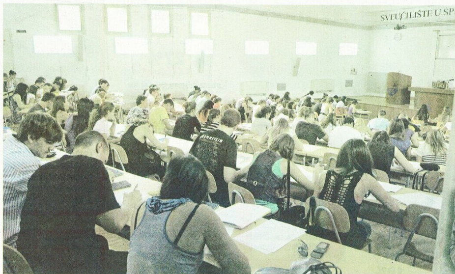
Već sljedećeg ljeta svi bi fakulteti trebali odustati od prijemnih ispita

Prema kalkulacijama prof. dr. Dragana Primorca, bivšeg ministra i pokretača projekta državne mature, 33 tisuće učenika ukupno bi polagali prijamni ispit na prosječno dva, tri mjesto što predstavlja 75 tisuća prijamnih. Prosječan ispit košta 250 kuna, a s obzirom da roditelji nisu direktno plaćali maturu, barem ne oni redoviti maturanata, uštede sežu do oko 18, 750,000 kuna. Ušteda je